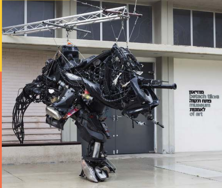
אבינועם שטרנהיים