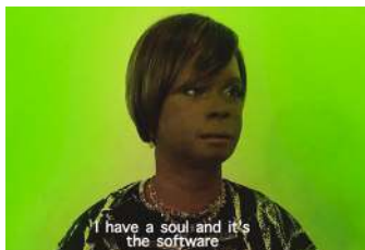
דימוי: דיאל סמול

תערוכה אינטראקטיבית המזמינה את המבקרים לחוות את הקשר בין טכנולוגיה ורגשות דרך עבודות וידאו מרתקות. האמנים בוחנים נושאים כמו בינה מלאכותית, מערכות יחסים עם אפליקציות, דימויים שמעוררים חוויות רגשיות ועוד. התערוכה מחברת מסורות אמנותיות יחד עם טכנולוגיה עכשווית ומציפה שאלות הנוגעות לחיי היומיום של כולנו.