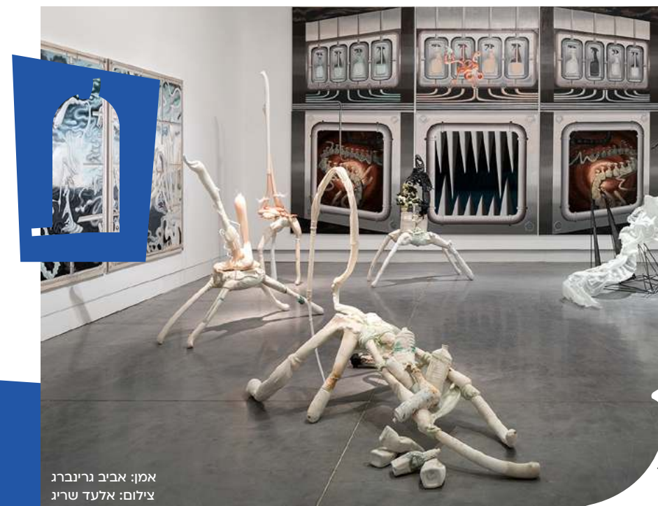
אמן: אביב גרינברג

אנו מציעים יצירת מעטפת המורכבת מתוכנית הלימוד הבית ספרית והעשרתה דרך מפגשים עם אמנות והקשריה הרחבים: מדע, זהות, תרבות, גאוגרפיה, היסטוריה וכו'. תכנית העשרה זו מיועדת לקידום חשיבה יצירתית, מקורית ומעמיקה על תכני דעת שונים, דרך עולם האמנות והיצירה. השיעורים כוללים מפגש מקדים עם תכני בית הספר וגיבוש תכנית מותאמת, התנסות בטכניקות יצירה רבגוניות, מפגש עם אמנים ועוד. בסיום הפרויקט תוצג תערוכה ברחבי בית הספר.