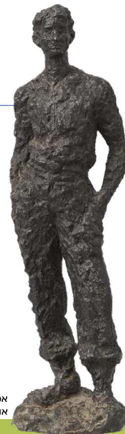
אמן: דב פייגין אוסף מוזאון פתח תקוה לאמנות