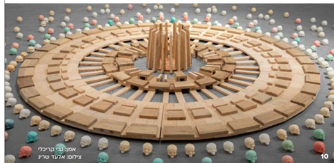
אמן: גבי קריכלי