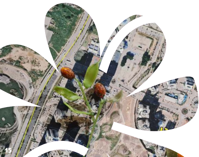
אמנית: דפנה קפמן

סדנת יצירה בה יכינו התלמידים נייר לוגו אישי כגון זה שעטפו בו את פרי ההדר.